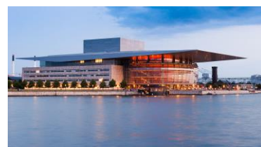
Den Kongelige Opera

Detaljer om resan kommer att finnas på www.vanforeningen.se