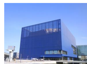
Danmarks Radios Konserthus