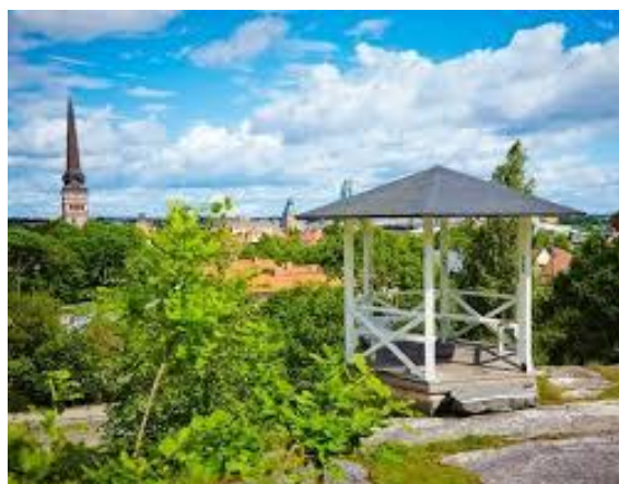
Utsikt från Djäkneberget

Pris för resan 1 995 kr/person Information och anmälan till resebyrå Central Europe Travel, info@cetravel.se eller tel 08 441 7190 senast den 20 februari.